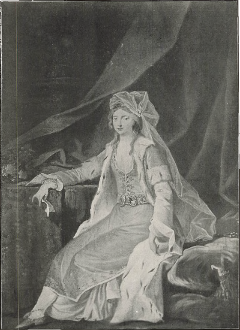
HERTUGINDE LOUISE AUGUSTA AF SLESVIG-HOLSTEN-SONDERBORG-AUGUSTENBORG, FØDT PRINSESSE AF DANMARK OG NORGE I MASKEBÆDEBAGT

Maleriet af Jens Juul . Af Konservator C. C. ANDERSENS Samling af Malerireproduktioner.