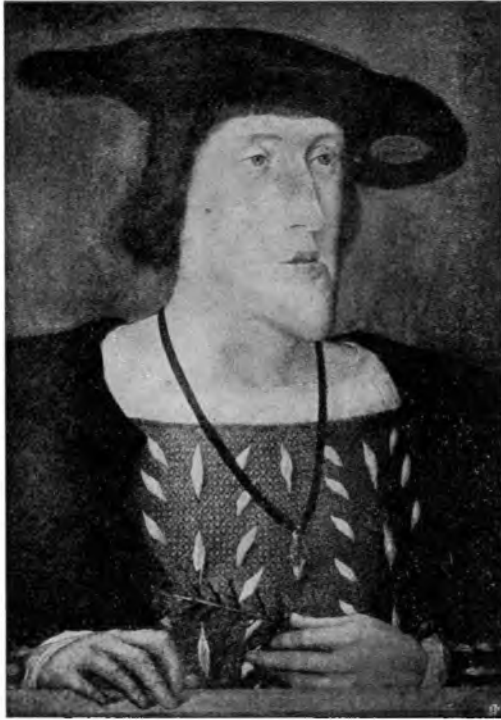
KARL DEN FEMTE, ca. 1515 (Ukendt flamsk Maler. Orig. i Windsor)