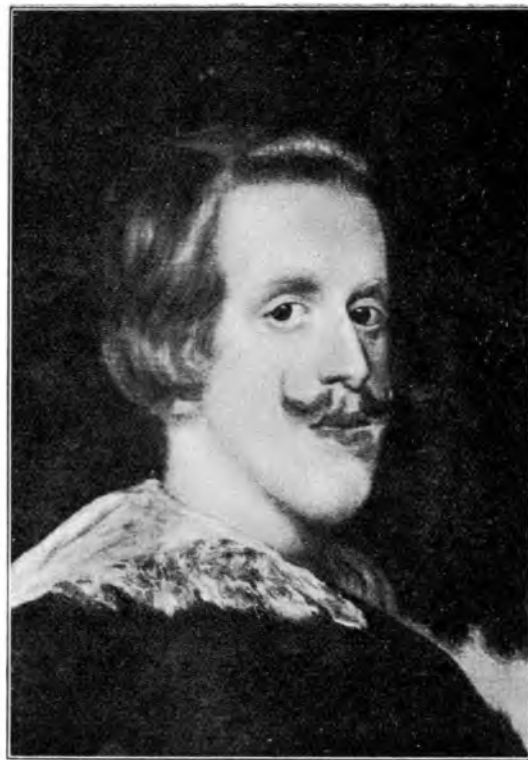
FILIP DEN FJERDE (VELASQUEZ. Orig. i Louvre)