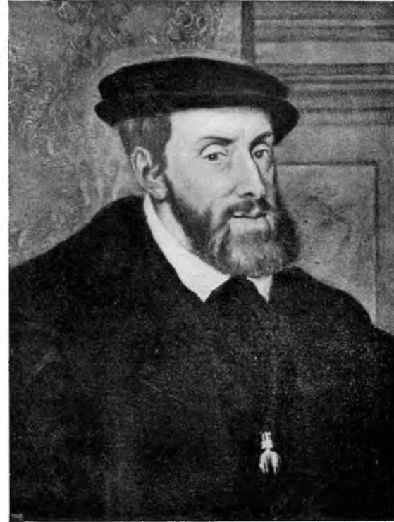
KARL DEN FEMTE, 1548 (TIZIAN. Orig. i München)