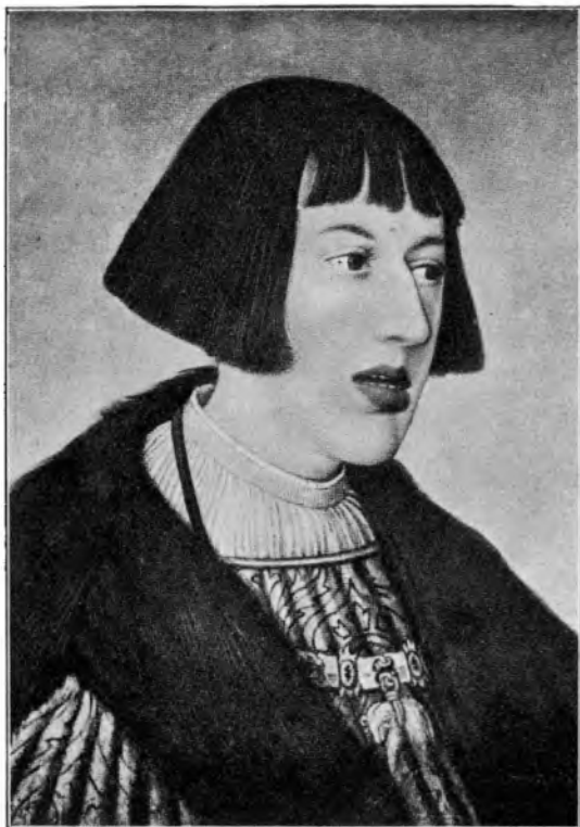
FERDINAND DEN FØRSTE (HANS MALER ZU SCHWAZ. Orig. i Wien)