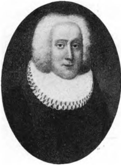
Malt før 1735.