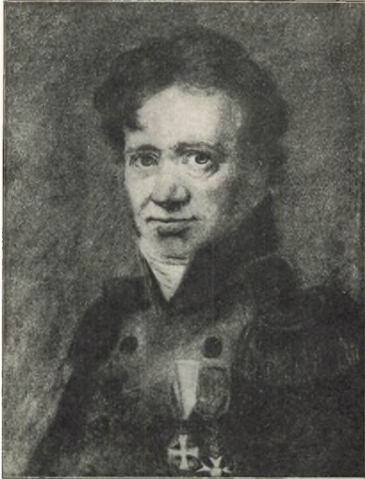
Kontreadmiral Cornelius Wleugel. Efter pastelmaleri (Privateie).

1. Cornelius Wleugel. F. i Kjøbenhavn 16. okt. 1764, blev sjøkadet i 1778, sekondløytnant i den dansk-norske marine i 1782, premierløytnant i 1789, kapteinløytnant i 1796, kaptein i 1803, kommandørkaptein i 1810, kommandør i 1815, og kontreadmiral i 1828. I aarene 1788 til 1791 bistod han sin far med administreringen av orlogshavnen. 1791—94 interimsekvipagemester,