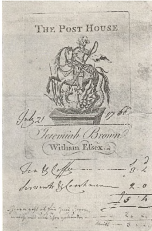
Abb. 1. Rechnung vom 21. 7. 1766.