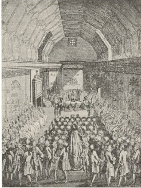
Abb. 4. Der englischen König im Oberhaus. Stich von T. Lodge 1769.

Die Anschaffungen betrafen ausser einigen Anzügen beim »Marchand tailleur Monsieur Kel« verschiedene, elegante Ausstaf-