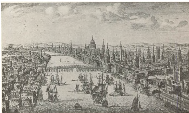
Abb. 2. London um 1770. Stich.

wagen genommen werden, dessen Lenker nicht ortskundig war, denn »ein Kerl, der uns den Weg durch die Stadt zeigte«, bekam 2 sh. Der erste Besuch am folgenden Tag galt zweckmässiger Weise dem Bankier Mr. Cottin , der die Geldzahlungen vermittelte. Nachmittags machte Ernst in der St. James Street Einkäufe: ausser einem Paar feiner Schuh- und Strumpfschnallen für 5 Pfund 14 sh. merkwürdigerweise »A fine pappier Machée Toothpicklare finely painted«, also ein Futteral für Zahnstocher, und ein Riechfläschchen für 12 sh. Diese Preise zeigen schon, dass in der zweiten Hälfte des 18. Jahrhunderts in England für alle besseren Hand-