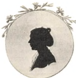
Arenza Birgithe Kierumgaard. 1784—1868.