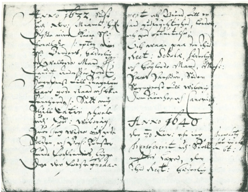
Opslag i optegnelsesbogen svarende til teksten gengivet nederst s. 3 og øverst s. 4.

Willum Jenssøns, hvilkes 6 sønner jeg med flid haver forestanden, en år 31 ) (hvor om jeg har deres rigtige vidnesbyrd). Er så forrejt til København igen.