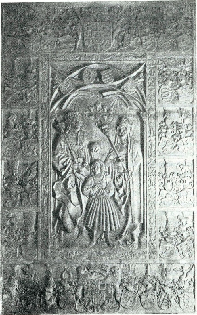
Odense, Sct. Knuds k., Kong Hans' gravsten.