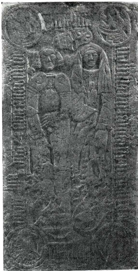
Mariager k., Randers a., Laurids Mogensen Løvenbalks ligsten, fot. 1931.

problemer op, og så bliver spørgsmålet: hvad er det rigtige? Spørgsmål af denne art kan selvsagt ikke besvares generelt, og jeg har ikke materiale nok endnu til en bredere almen vurdering af dette kildestofs værdi, men som det ser ud for mig i øjeblikket, så tror jeg at måtte sige, at kildeværdien er forholdsvis ringe. Den absolutte sikkerhed rækker næppe ud over de 4 bedste-forældres våbener. Dermed har jeg ikke sagt, at der ikke er mere, der er rig-