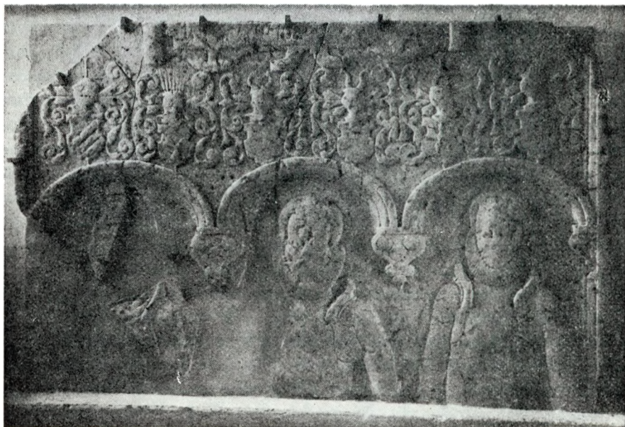
Hammelev s., Gram h., Haderslev a., „Breide-stenen“, gravstensfragment, fotograferet 1953.

Gravstenen er det primære objekt for anbringelsen, men det varede ikke længe før anetavlen derfra bredte sig til epitafierne eller blev malet på kirkens vægge, anvendt på pulpiturer eller herskabsstole for derefter at lade sig finde på kisterne i det 17. århundrede, især naturligvis på de sarkofager, der stod fremme i kapellerne og endelig også – det er endnu i tiden fra omkring 1570 – i broderi på vægtæpper, sengetæpper eller brudehimle. Og da det ligeledes i den sidste tredjedel af 1500-årene bliver skik og brug at trykke ligprædikerne, så varer det ikke længe, før man fra den egentlige biografi udskiller oplysningerne om forældre og herkomst. Fra omkring 1600 er den egentlige anetavle – tekstanetavlen – et integrerende led af ligprædikenens personaleafsnit, der opbygges efter et helt fast skema, og snart optages kobberstikket som den naturlige udsmykning af den trykte prædiken, og også her finder våbenanetavlen sin naturlige plads som uundværligt led i kompo-