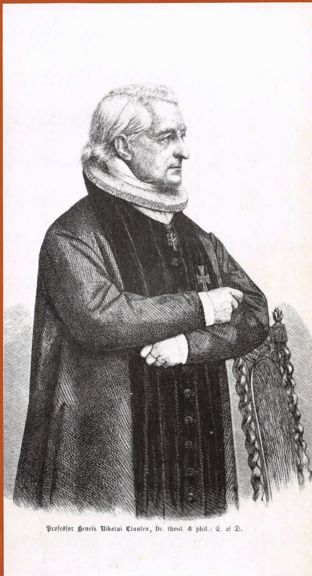
Profesør Henrik Nikolai Clausen, Dr. theol. & phil.; C. af D.