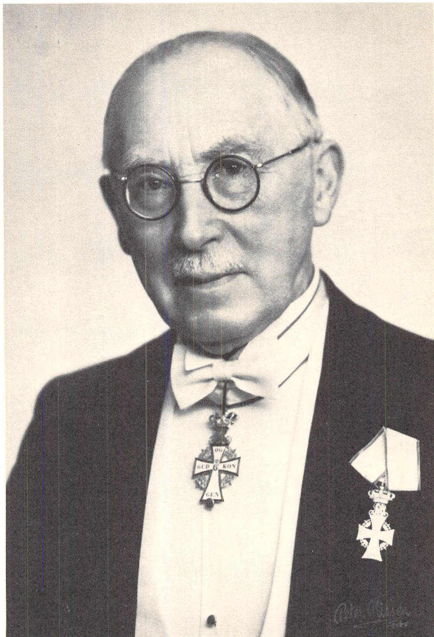
Nicolai Svendsen 1873–1966