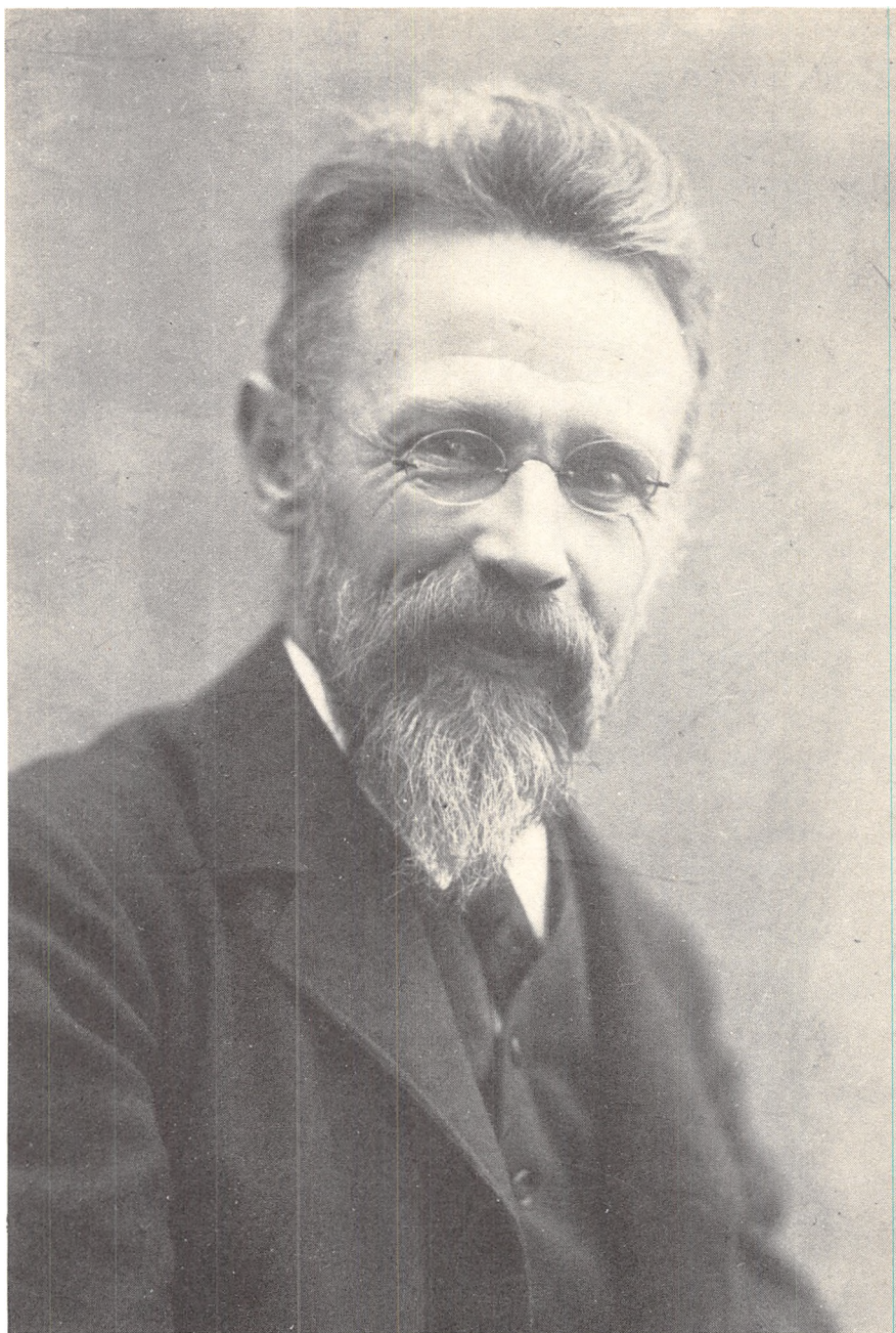
Kristian Sofus August Erslev 1852–1930