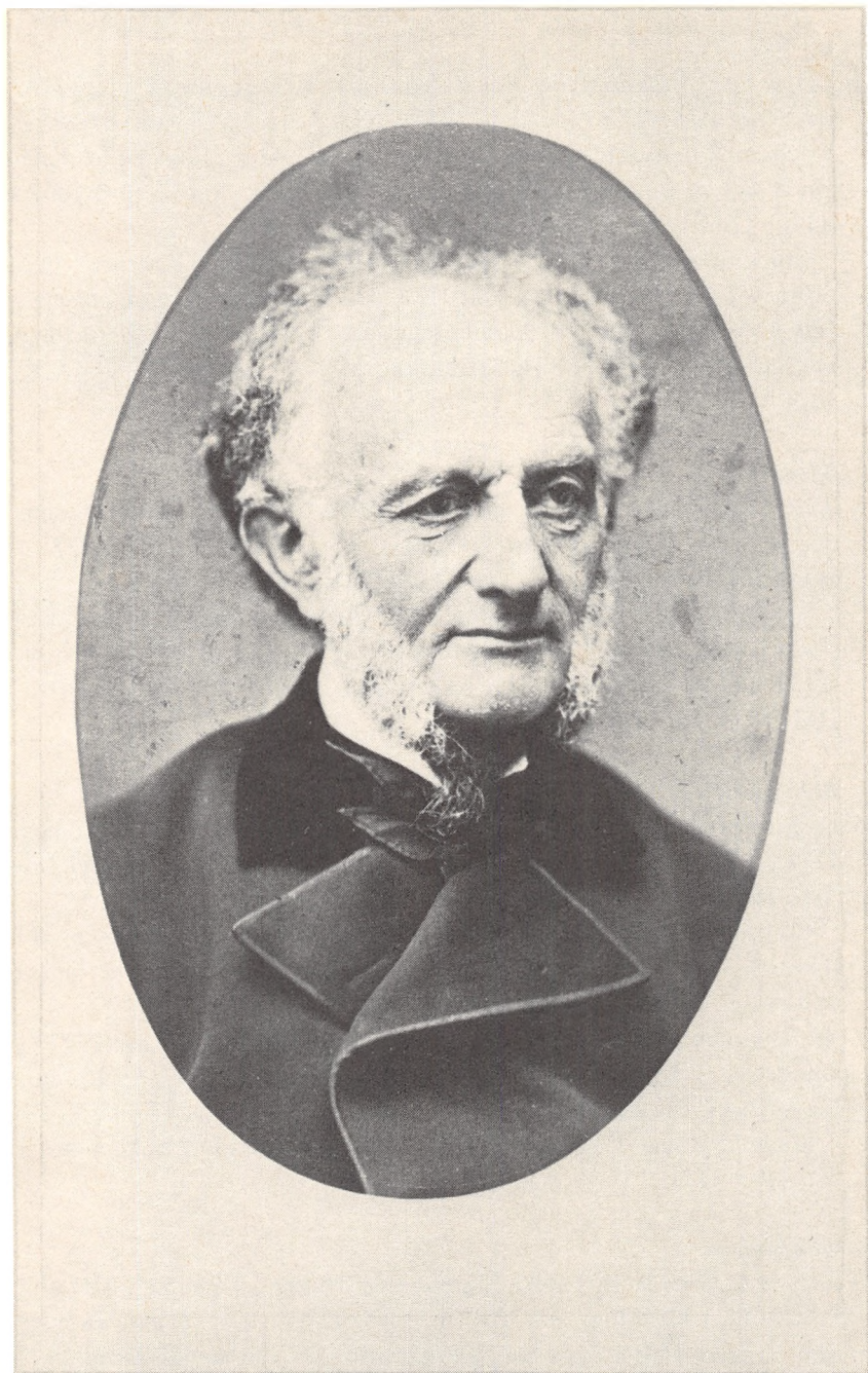
Casper Paludan-Müller 1805–1882