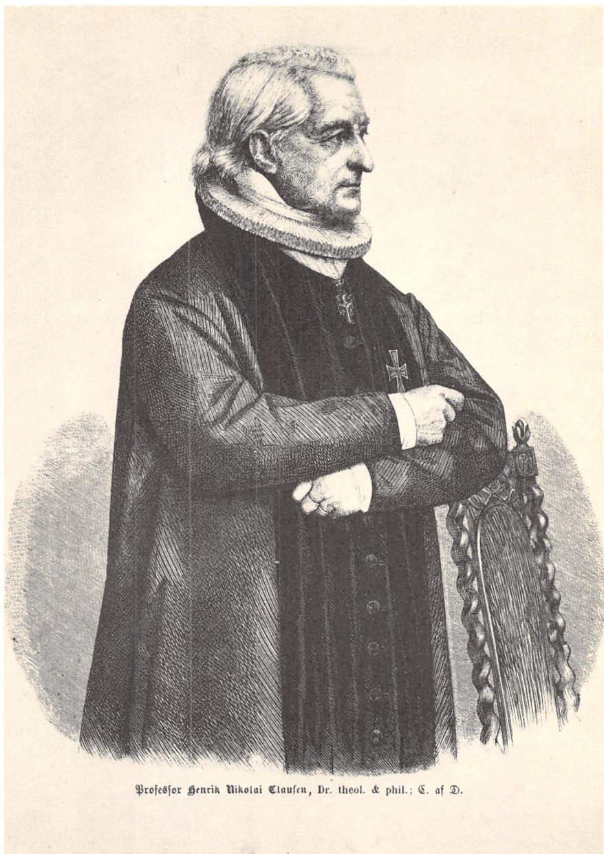
Professor Henrik Nikolai Clausen, Dr. theol. & phil.; C. of D.