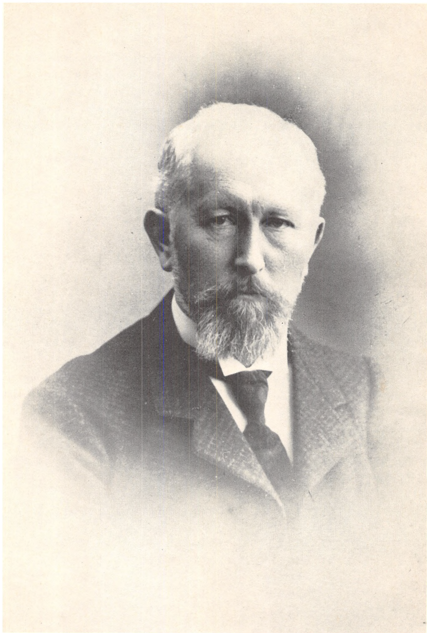
Jannik Bjerrum 1851–1920