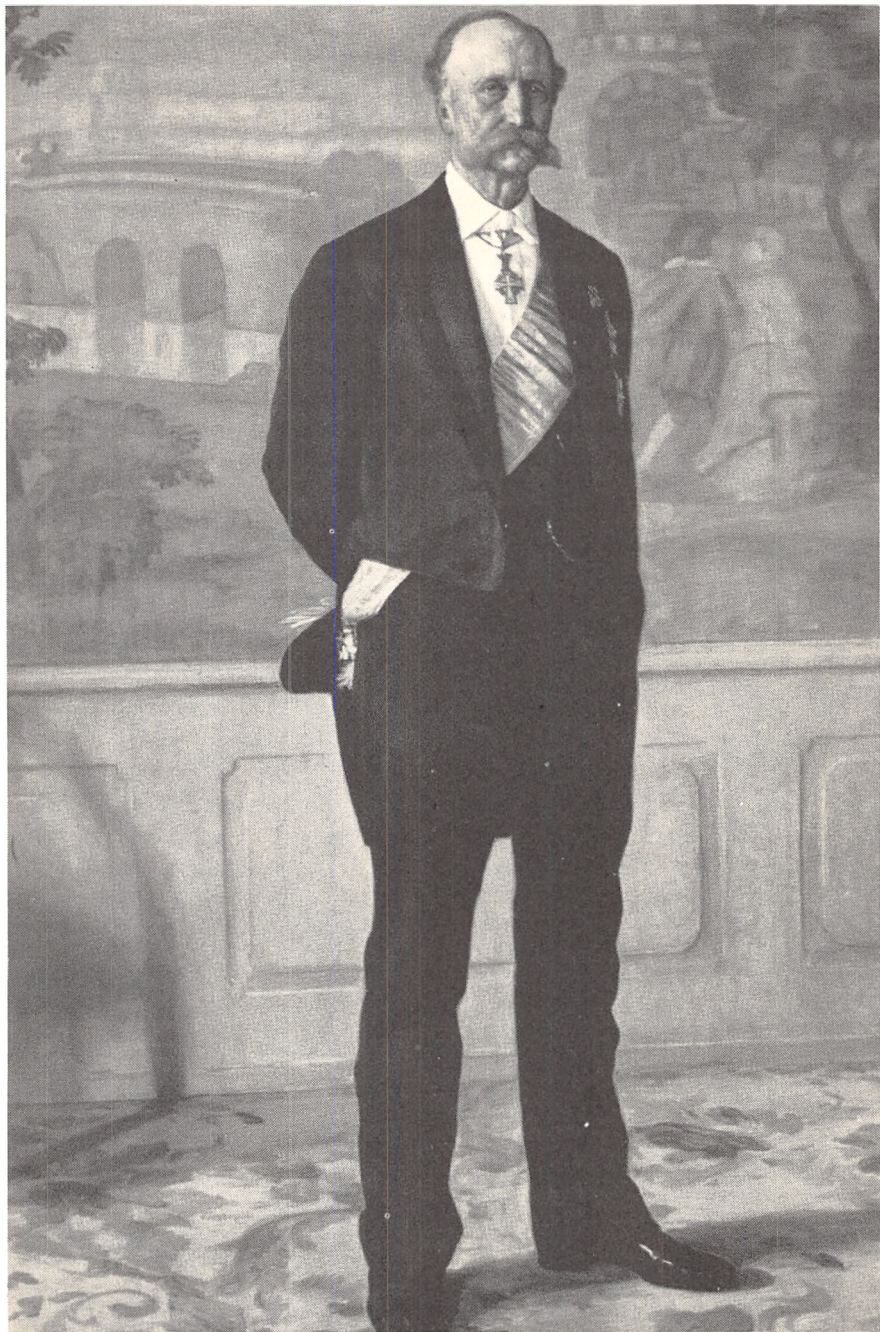
Konseilpræsident J. B. S. Estrup Efter A. Jerndorffs Maleri (1895) på Frederiksborg